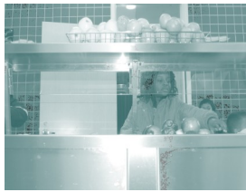
Los padres nos dicen que sus niños les reportan usualmente la intimidación que sucede en las líneas para ir a tomar almuerzo, pasillos, baños y en los lugares de recreación escolar.

Si usted es un estudiante, padre/tutor u otro miembro de la comunidad ; solamente diga a un adulto en la escuela lo que ha pasado. Usted puede decirle a ellos en persona, escribiéndoles una nota, enviando un correo electrónico o dejando un mensaje en la contestadora electrónica. El adulto al que le dijo, reportará el incidente al Principal y completará las formas requeridas.