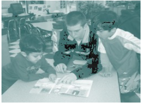
Manteniendo el ambiente de aprendizaje seguro para todos los maestros, voluntarios, familiares y estudiantes es una prioridad de las Escuelas Públicas de Somerville.

Un ambiente de aprendizaje seguro, es en el cual cada estudiante se desarrolla emocionalmente, académicamente, y psicológicamente en una atmósfera de cuidado y apoyo; libre de intimidación y abuso. Una de las metas de las Escuelas